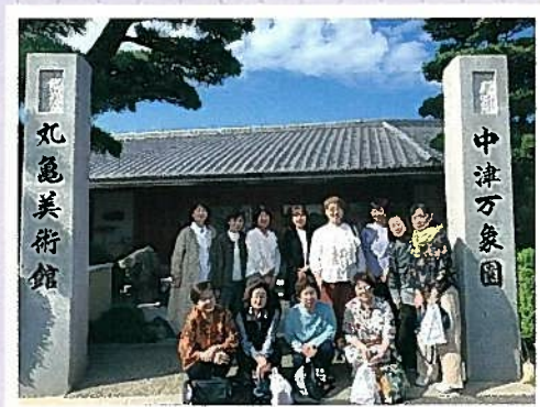
中津万象園 丸亀美術館