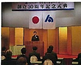
寺曾部会長あいさつ