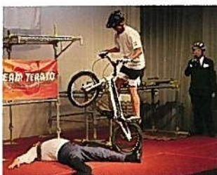
バイクトライアル