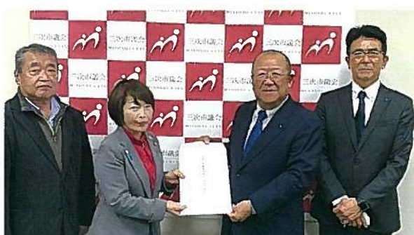
税制提言：三次市議会議員