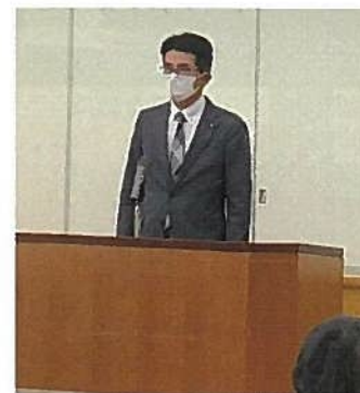
松尾副会長 あいさつ