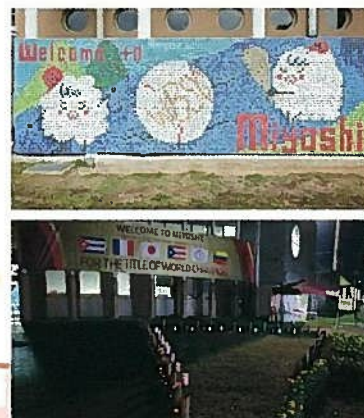
WBSC女子野球ワールドカップ予選大会 心温まるおもてなし