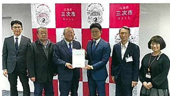
税制提言：三次市長