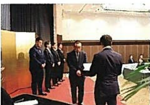
歴代部会長表彰式